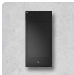
2N® IP STYLE (PODPORUJE ZABEZPEČENÉ KARTY) 9157101-S